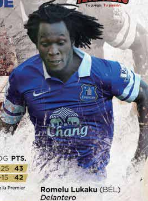
Romelu Lukaku (BÉL) Delantero

Ambos vienen de sendas victorias, y clasificaciones, en la Copa FA . Las últimas 3 veces que se vieron por Premier terminaron empatados. Liverpool mantiene un invicto de 7 juegos ante su clásico rival. Es más, los "reds" no pierden ante los "toffes", en Anfield, hace 15 ocasiones (la última fue el 26/09/99).