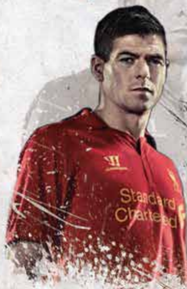
Steven Gerrard (ING) Volante

Con 6 tantos es el 3er goleador del club en el torneo. Suma 6 asistencias, 4 de ellas en casa. A lo largo de su carrera le anotó 3 veces al Arsenal, la última en 2007.