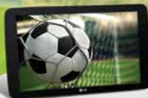
24 TABLET LG - LGV700