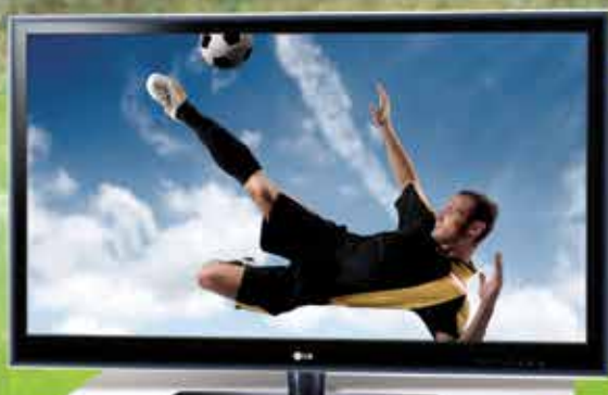
16 TV LED 55" LG

ACUMULA PUNTOS CON CADA BOLETO DE S/.10 DE TE APUESTO Y PARTICIPA EN LOS SORTEOS DE INCREÍBLES PREMIOS: